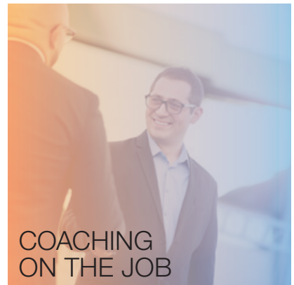
COACHING ON THE JOB

Individual Knotenlöser – Prinzip - Coaching bietet einen geschützten Rahmen, um neue Perspektiven im Denken und Handeln zu entwickeln und außergewöhnliche und belastende Erfahrungen zu verarbeiten. Der Coach hat während des gesamten Coachingprozesses die Ressourcen = Kraftquellen des Klienten im Blick und adressiert diese immer wieder gezielt. Sich auf eigene Stärken und positive Erfahrungen in vergleichbaren Situationen besinnen, hilft schwierige Zeiten überwinden.